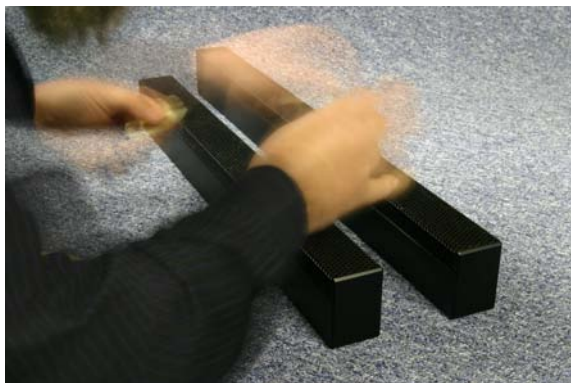
Endfertigung Stoll Picoline

Stoll Audio hat im Rahmen der Renovierung des Schweizerischen Parlamentsgebäudes über 40 Lautsprecher (Zeilenlautsprecher Typ „Picoline“) für die Sprachübertragung nach den Produkthanforderungen der Walters-Storyk Design Group (WSDG) entwickelt und hergestellt.