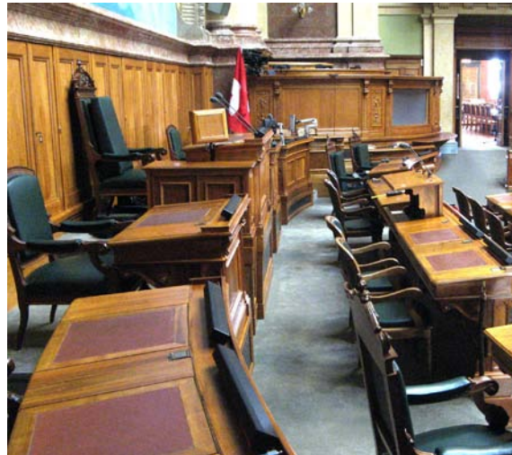
Stoll Picolines 585 auf der Bühne

Für die Bühne des Nationalratssaals wurden 23 Stück „Picoline 585“ und für die Tribüne (Zuschauerbereich) wurden 20 Stück „Picoline 490“ gefertigt. Durch die Massanfertigungen der Aluminiumgehäuse mit 40mm Breite, 58mm Tiefe und einer Länge von 490mm respektive 585mm wurde die Vorgabe einer kompakten Bauart erreicht. Die äusserst verzerrungsarmen Lautsprecher bewirkten eine signifikante Verbesserung des gemessenen Speech Transmission Index (STI).