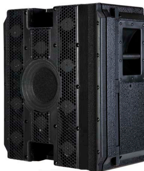
Stoll CFR 2610 Convertible (nutzbar als Punktrahler oder als Element eines Line Arrays)

Die kompakten und leistungsstarken Lautsprecher der Marke Stoll bieten dem professionellen Nutzer sowohl eine hohe Übertragungsqualität und –sicherheit wie auch eine flexible und modulare Anwendbarkeit.