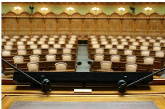
Stoll Custom Picoline zur Sprachbeschallung im Schweizerischen Parlament in Bern

In unserer Werkstatt bauen wir individuelle und optimal angepasste elektroakustische Wandlerysteme. Dabei ermöglicht die Produktentwicklung von Stoll Custom kostenoptimierte Speziallösungen auch in Kleinauflagen.