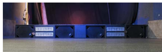
Vier Stoll Custom Subwoofer für die Installation unter einer bestehenden Bühne

Stoll Audio kennt alle für den Lautsprecherbau relevanten Technologien und ist auf dem aktuellen Stand der Wissenschaft und Technik.